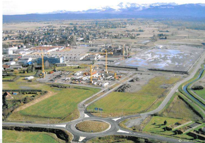
Turbomeca Bordes, vue depuis le Nord, le 13 Janvier 2008